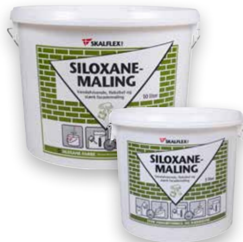
10 liter, DB-nr: 5865145 (Hvid) 5 liter, DB-nr: 5961515 (Hvid)

Genmaling/farveskift kan ske med Skalflex Siloxanemaling.